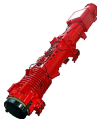
Схема и технические характеристики дизель-молота D100-13

Расходные материалы и наголовники в комплект не входят, заказываются отдельно в зависимости от потребностей покупателя.